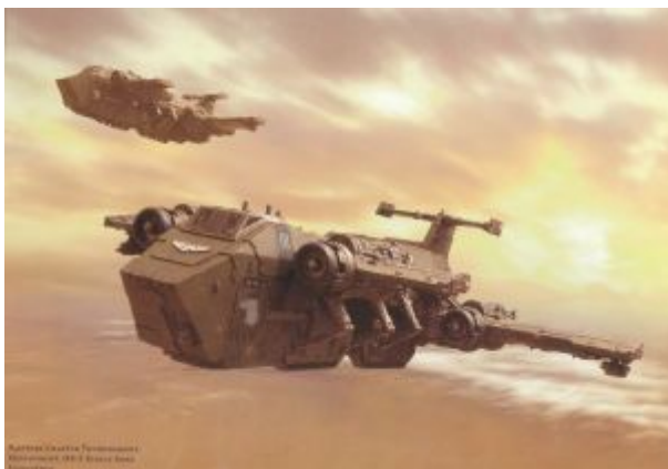
Применение «Громова ястреба» орденом Рапторов в зоне джунглей DX-2, Гаргатея