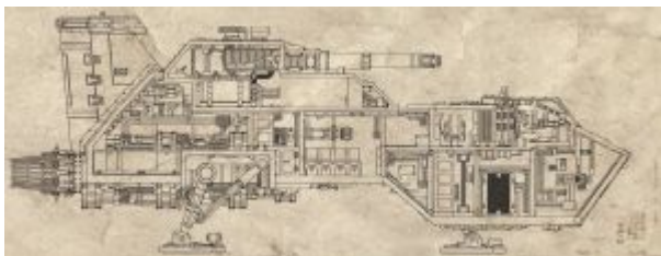
Внутреннее пространство десантно-штурмового «Громова ястреба»