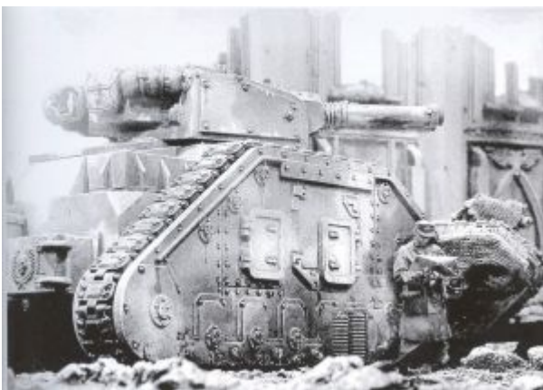
«Экстерминатор» модели «Грифонна IV» ждет новых приказов. Командир машины позволяет хорошо представить размеры танка.