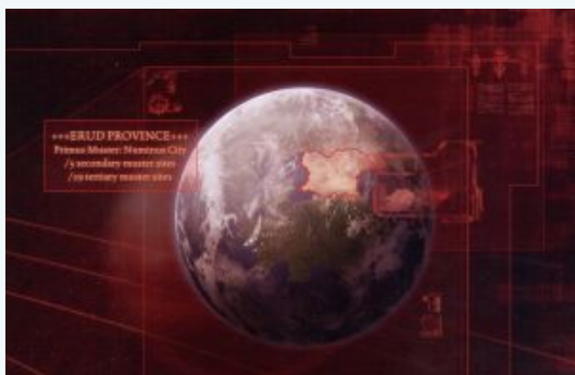
+++ Провинция Эруд +++ Главный сбор: город Нумин /5 вторичных точек сбора /29 третичных точек сбора

Но истинная ценность Калта для Пятисот Миров и причина таких капиталовложений в его развитие состояла в том, что он служил ярким символом будущего человечества. После того как Великий крестовый поход начал близиться к завершению, примарх Гор облачился в мантию магистра войны, а Император Человечества вернулся на Терру руководить очередным этапом расширения Империи, великие лидеры вроде лорда Гиллимана пытались найти свою роль в этом будущем. Жители Ультрамара неимоверно гордились построенным им царством, и с надеждой смотрели в светлое будущее, где Ультрамар и великий Империи благожелательно присматривали за тем, как меняется Галактика ценою жертв и усилий двухвекового завоевания. Одна трагедия из множества, вызванная вероломством магистра войны Гора и предавших Легионес Астартес, заключается в том, что этому будущему так и не судилось случиться.