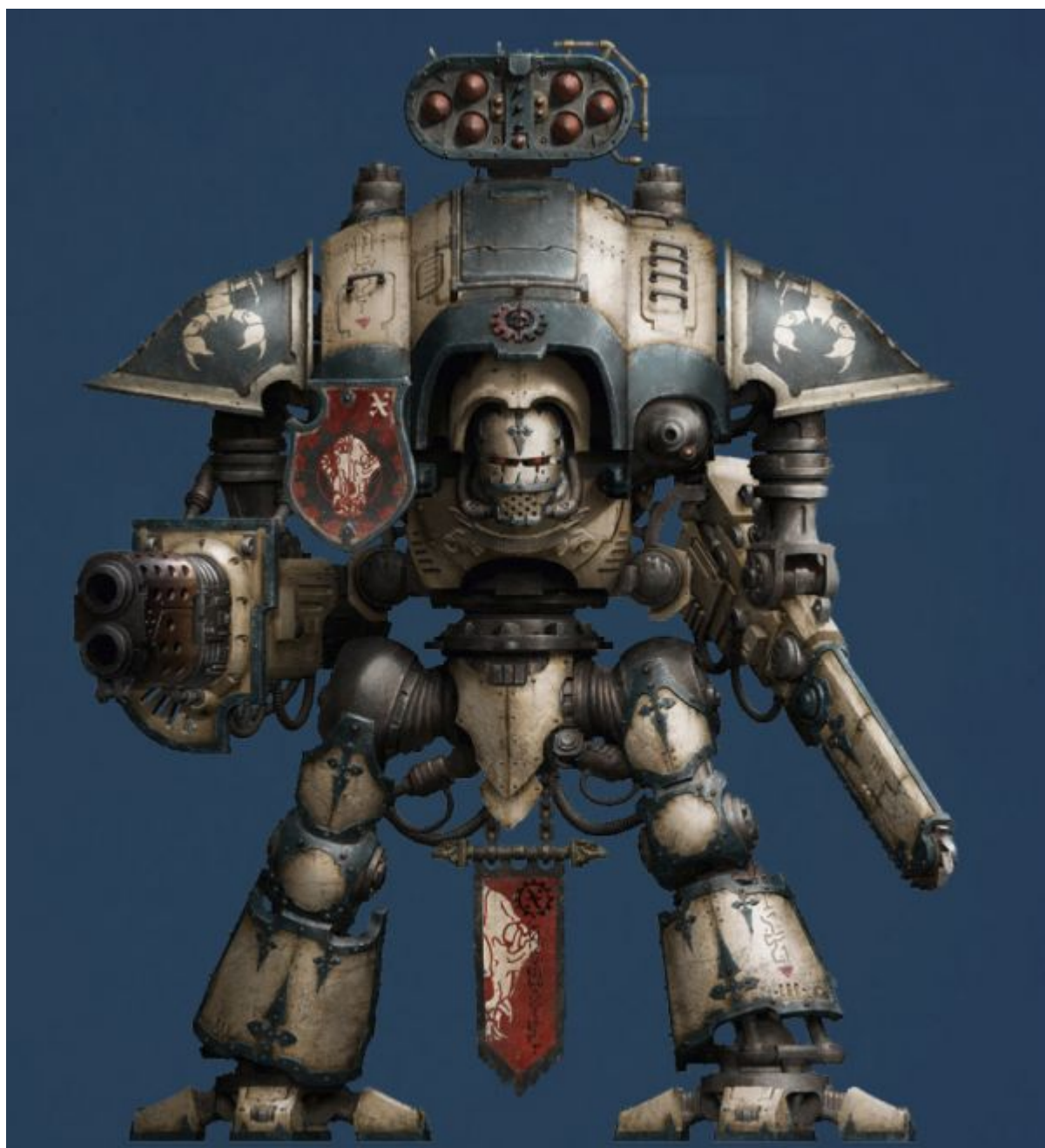
Рыцарь «Квесторис-Странник» дома Малинакс

Пример одного из редчайших рыцарских доспехов, находившихся в распоряжении дома Малинакс, «Шотлатлик» управлялся отпрыском Мачтектланом во множестве сражений, включая несколько битв времён Железного крестового похода. Особого упоминания заслуживает явное мастерство Мачтектлана в борьбе против вражеских титанов - отпрыск умело пользовался подавляющей огневой мощностью, которую «Шотлатлик» мог предложить для непосредственной поддержки охотничьих стай разведывательных титанов Легио Аудакс, чтобы повергнуть сильнейшего из врагов. Это партнёрство между легионом титанов и рыцарским домом в конечном итоге закончится предательством - извлечённые из разрушенного остова «Шотлатлика» журналы целей отметят титанов Легио Аудакс как врагов в последние моменты существования машины, а причиной этого акта измены станет спор о том, кому же принадлежит право на последнее убийство.