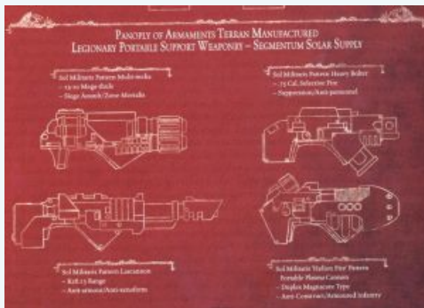
Комплект вооружения терранского производства, легионерское переносное оружие поддержки из поставок сегментума Соляр