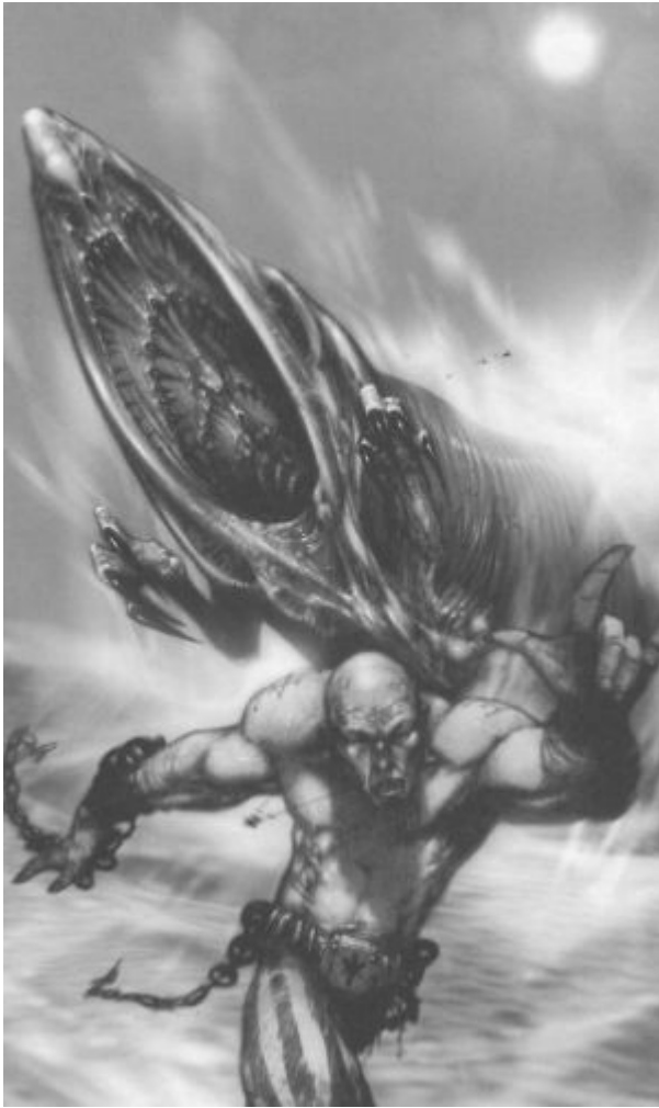
Иллюстрация из Inferno! №41

Жар поднимался от песков, словно живое существо. Он переливался и перекатывался через дюны, заставляя глаза слезиться. Я моргнул, множество туманных геометрических фигур медленно двигалось по моей сетчатке, мельчайшие математические символы рябили в солоноватой воде слезинок. Затем я на мгновение закрыл глаза, отдыхая от резкого света.