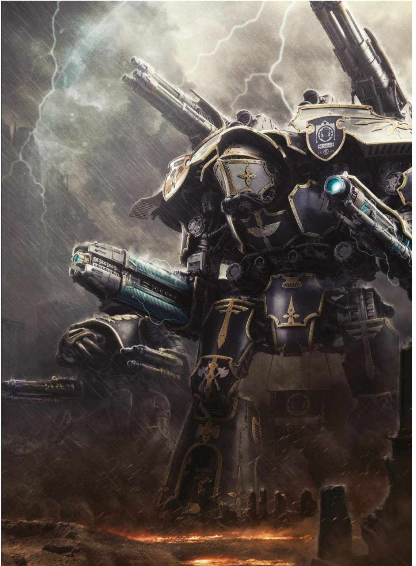
Особенность Легио: Рождённый в кузне