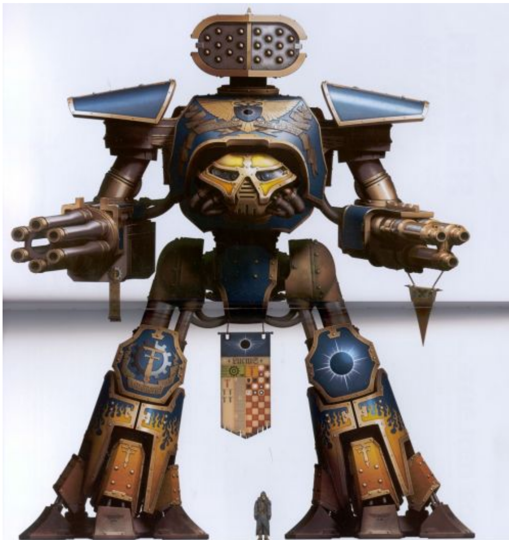
«Инвигила Альфа», титан типа «Разбойник», уничтоженный прямым попаданием в кабину во время сражения за сектор 54-46.