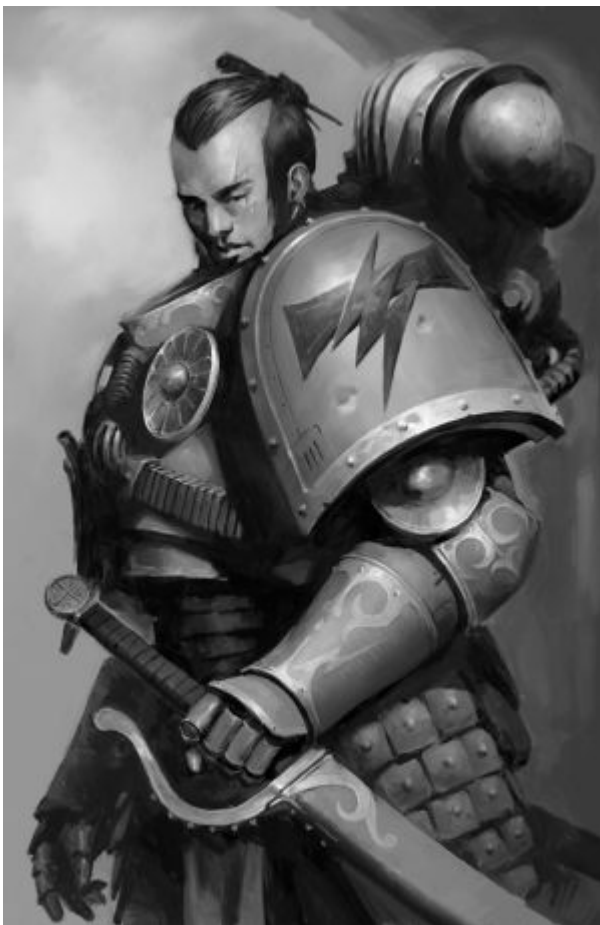
Джангсай-хан, братство Железного Топора

- Хай Чогорис! - воскликнул он. - Слава Кагану. - Затем с еще большим чувством. - И тысяча смертей его врагам.