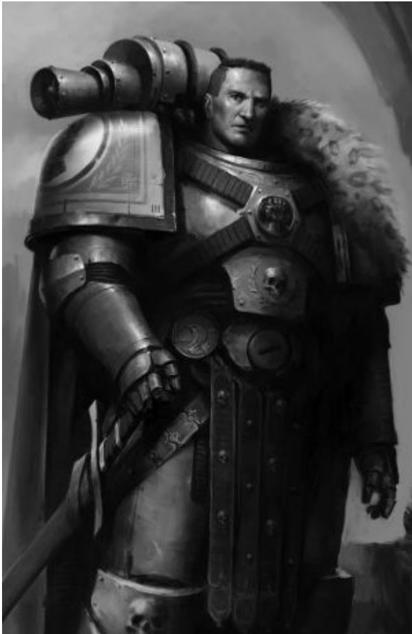
Архам, магистр хускарлов